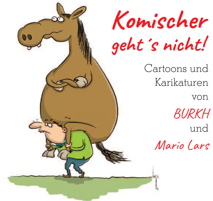
Wenn Vegener reiten