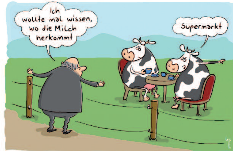
Politiker auf Sommertour